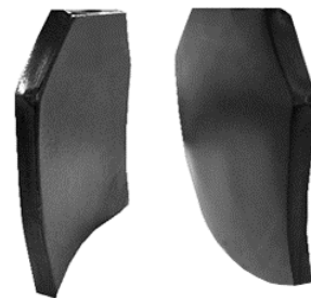
platen van boorcarbide

Onderzoekers aan de universiteit van South-Carolina hebben onlangs een methode ontwikkeld om katoen te versterken met boorcarbide. Zo zou je van een gewoon katoenen T-shirt kleding kunnen maken dat kogelwerende eigenschappen heeft en toch licht en flexibel is.